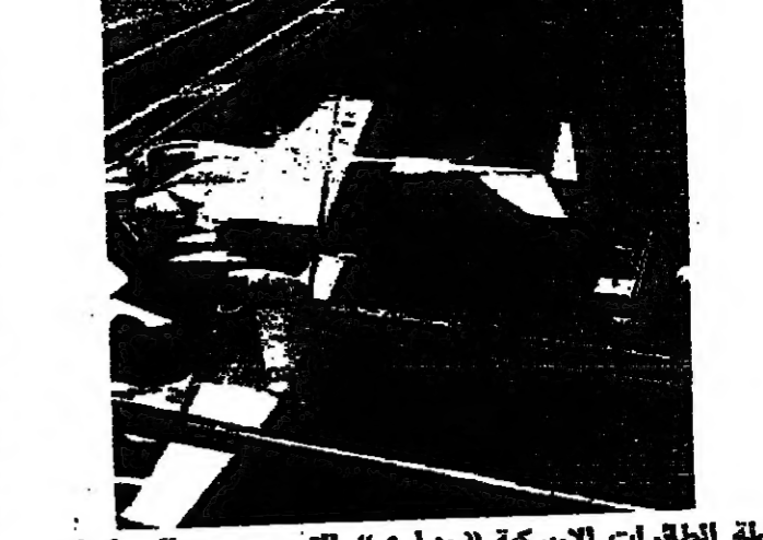
حاملة الطائرات الأميركية (بيداوي) التي وجهت الى ايران

وهذه القاسية قام جدال في اليابان بين علماء الأحياء وبعضهم يعتبرون الكلاب حيوانات إلى عشر سماعات نوم كل يوم ولا يستحسن ان يضر ساعة نوم واحدة لمشاهدة التلفزيون ويضخم يعتبر بالمعنى ان الكلاب بحاجة ماسة الى التلفزيون فضلاً عن انه يسليه انما يساعده على الاستمتاع بالوقت الذي يقضيه في البيت. «نسيان هومو وقلقه النفسي» من المستحتمات أيضاً انه ظهرت في اليابان مخازن تباع ملابس للكلاب وأحذية... ومجوهرات... ما هو عدد الكلاب في اليابان؟ كانت وزارة الصحة تقدم سنة ١٩٧٧ نحو اربعة ملايين كلب ويقال ان هذا العدد قد تجاوز اليوم خمسة ملايين. ومن آخر انباء الشرطة اليابانية انها «أوتفت» مشروب الكلب المساق الذي قال انه وقت دالماً الى جانب الولايات المتحدة. واعتزف كيسنجر خلال المقابلة